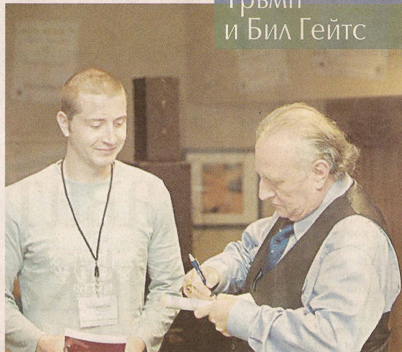
Александър Попов с учителя си д-р Ричард Бандлър

Гуруто на милионерите разкрива тайната на Доналд Тръмп и Бил Гейтс